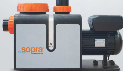
sopra-Filterpumpe Premium VS