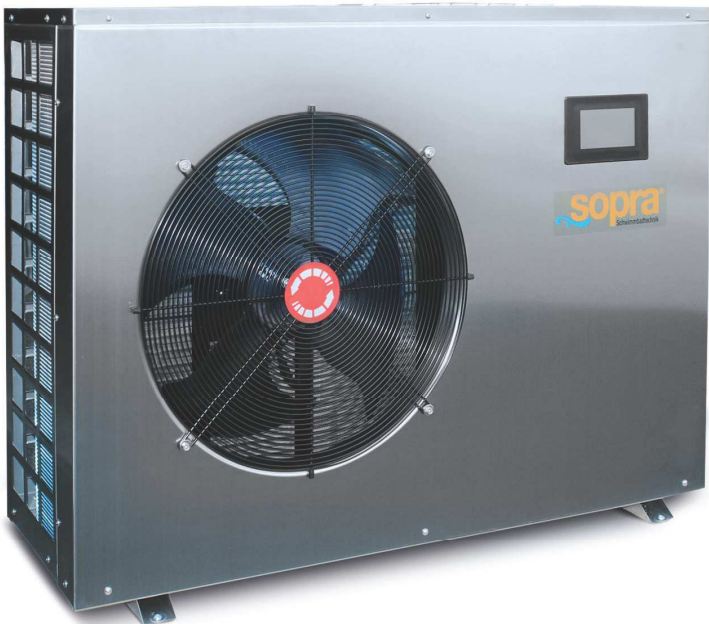
horizontale Inverter Wärmepumpe Gehäuse aus Edelstahl