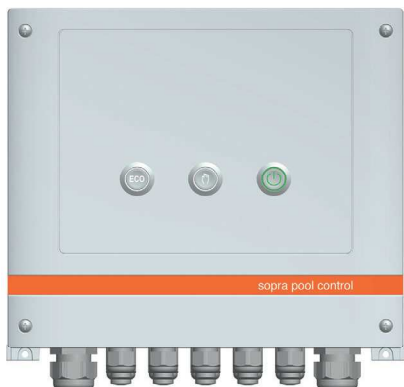
sopra pool control

Panel optional erhältlich, Smartphone nicht im Lieferumfang enthalten