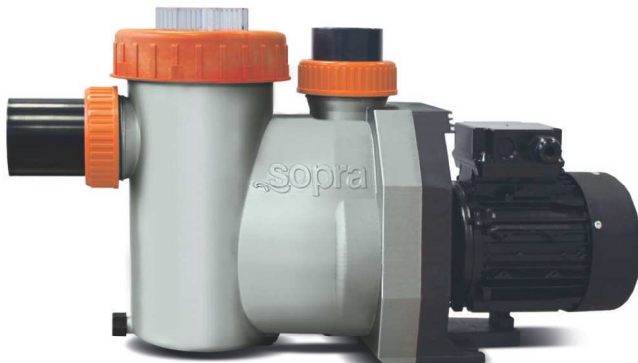
sopra-Filterpumpe Perfekt / Perfekt VS

Das neue Sortiment wird in einem zweiten Schritt durch den eigentlichen Star, die Baureihe „sopra-Filterpumpe Perfekt“, ergänzt. Diese basiert auf einem neuen effizienteren Pumpengehäuse, welches mithilfe aufwendiger Strömungssimulationen konstruiert wurde. Das exklusive Gehäusedesign bringt den technischen und hochwertigen Anspruch der sopra AG zum Ausdruck und wird, dank des Leistungsspektrums von 7 – 30 m 3 /h, die Hauptrolle einnehmen. Ergänzt werden die konventionellen Antriebe durch eine drehzahlgeregelte Ausführung mit effizientem Synchronantrieb von 3 – 30 m 3 /h. In dieses Pumpengehäuse werden 15 Pumpentypen mit verschiedenen Leistungsstufen eingebaut.