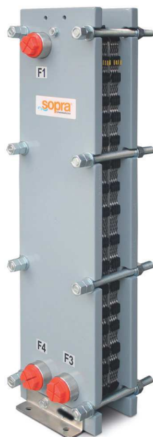
Plattenwärmetauscher Platten aus Titan