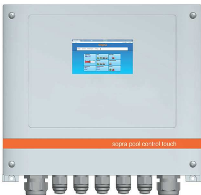
sopra pool control touch