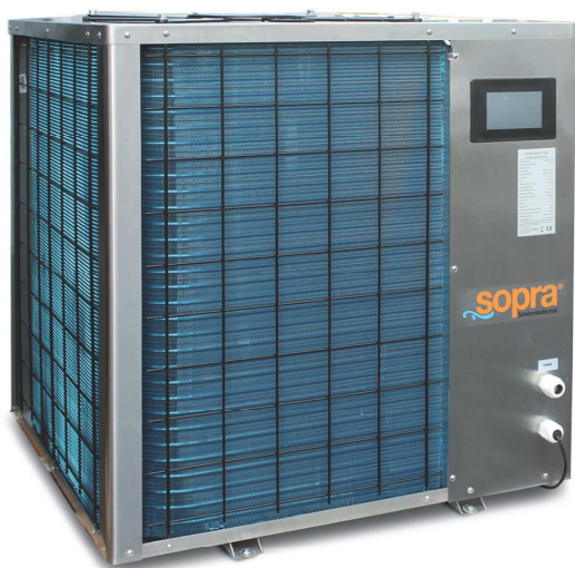
vertikale Inverter Wärmepumpe Gehäuse aus Edelstahl

Bei dieser Bauart wird der Umgebungsluft die Wärme entzogen und dem Beckenwasser zugeführt. Geringer Montageaufwand und die Optimierung der Wärmepumpe auf diesen Einsatz im Freibad ist der Garant für einen hohen Wirkungsgrad und geringe Betriebskosten.